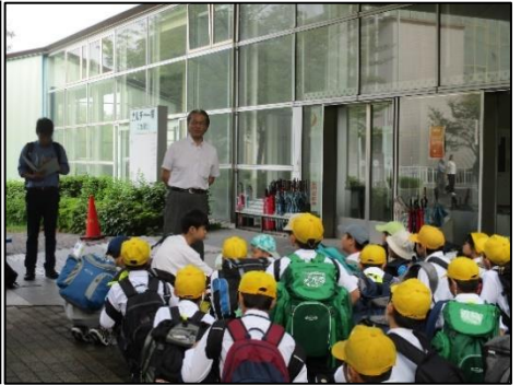
<朝会をしてみんなで登校>