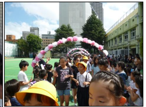
<どこまでも続くアーチ>