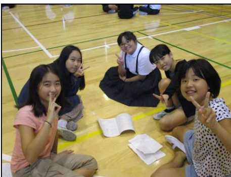
<楽しかった話でいっぱい！>

お別れ式では猿楽小学校のお友達と3日間の思い出を語り合いました。そして、長いアーチを作ってくださいみんなとの別れを惜しみました。来年また金山で会いましょう。