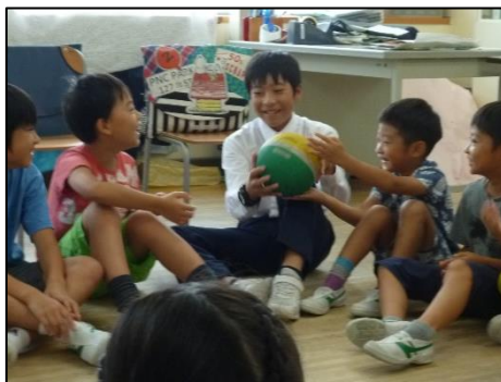
<いつも遊ぶ兄弟のように>