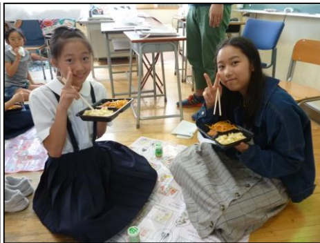
<遠く離れた同い年♪>