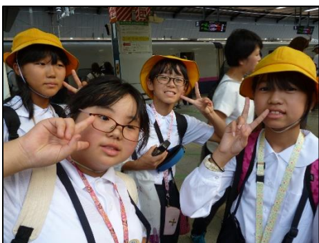
<また東京に来たいね>

楽しかった3日間を胸いっぱいにして、新幹線へと急ぎます。3日間様々なサポートをしてくださった猿楽小学校の先生やPTAの方が駅まで見送って下さいました。姉妹校交流を支えてくださる方々や送り出してくださいました家族の方、地域の方には本当にお世話になりました。ありがとうございました。