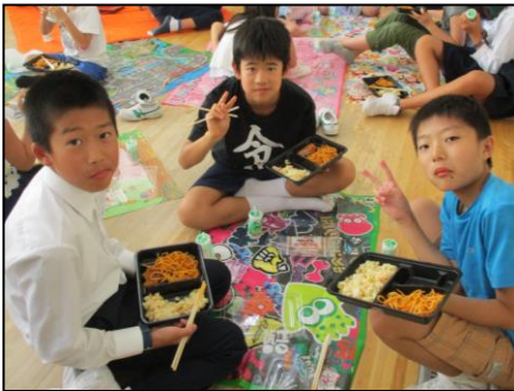
<同じ弁当で仲良し度アップ>

お昼はレクリエーションの班で昼食でした。準備してくれたシートに弁当をもってピクニックのような和気あいあいとした食事でした。最後に撮った写真もまた、交流の歴史になっていきます。