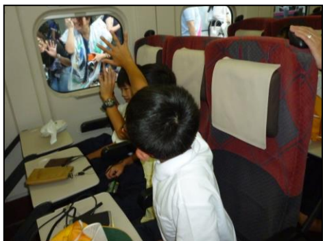
<お世話になりましたー！>