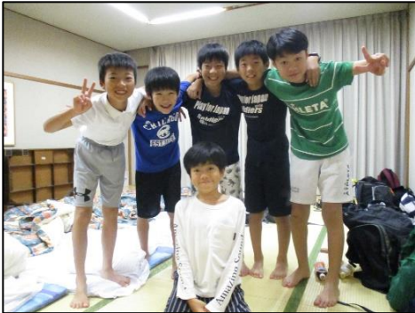
<おはようございます！>

昨夜は金山小と猿楽小の児童と枕を並べて寝ました。学校での過ごし方や昼間に行った渋谷区巡りの話に花を咲かせ、楽しい夜を過ごしました。朝はビルを見上げながら、仲よく猿楽小学校に登校です。