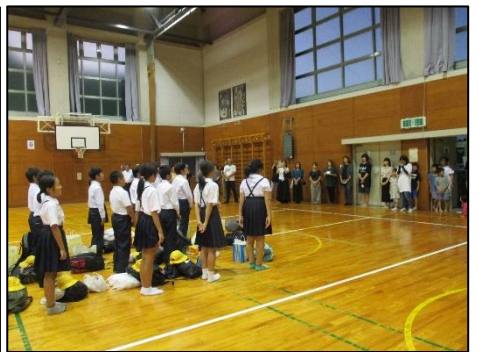
<笑顔でお礼ができました>