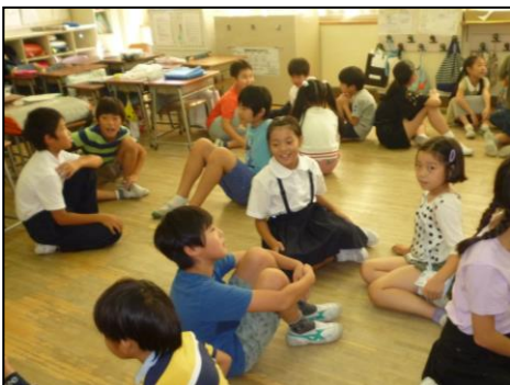
<みんなの名前覚えられるかな？>

発表のあとは、猿楽小学校の全校児童がレクリエーションを準備してくれていました。1年生から6年生までが班を組み、自己紹介ゲームやいかだゲーム等をして笑顔あふれる時間になりました。