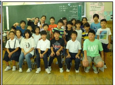
<大切な歴史の1ページ>