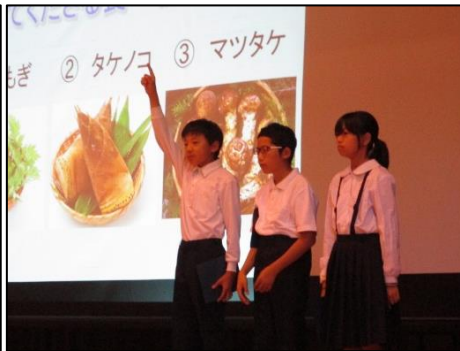
<盛り上がった金山クイズ>