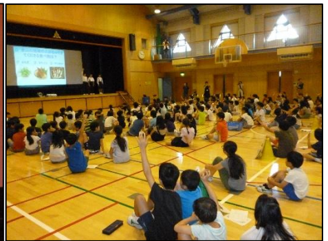
<金山の素敵は伝わったかな？>