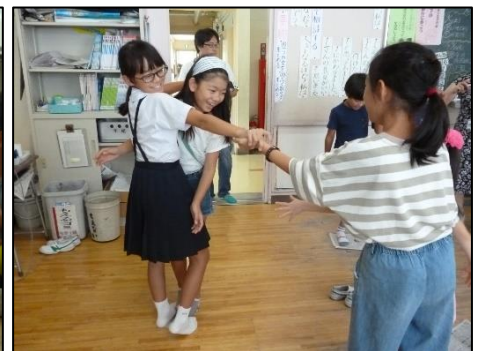
<支えあって大成功！>