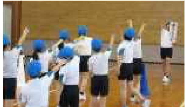
色団全員での力強いかけ声

5月2日(火)の色団結成集会では各色団の団長に団旗を渡しました。どの色団の団長からも団旗を受け取った後、強い気持ちのこもった返事がありました。その後、各団長・副団長のリーダーシップのもと、力強いかけ声を