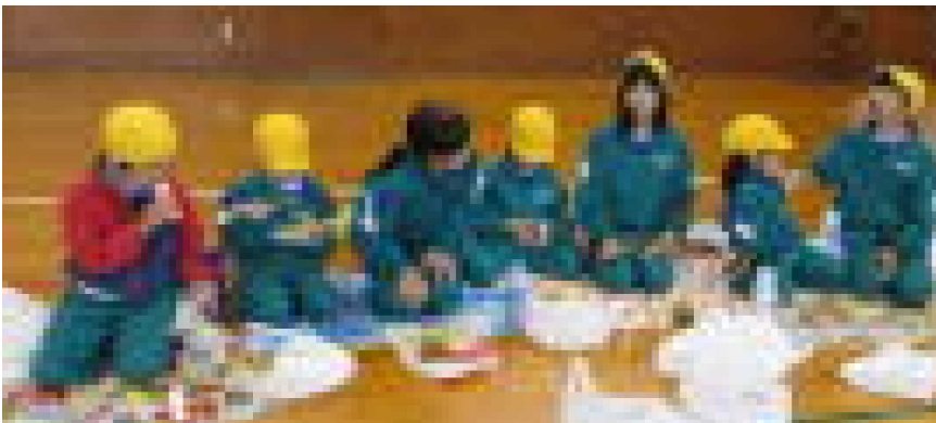
わきあいあいと食べて団結力が高まった色団結成ランチ

5月9日(火)には、色団の団結力をより一層高めようと「団結ランチ」を行いました。久しぶりに全校一斉に集まり、同じ色団の仲間と楽しく食べたことでより一層団結力が高まっていったように感じます。