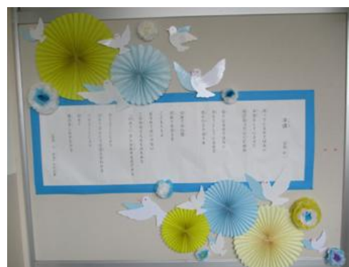
校長室前の詩の掲示

うかぶことにより / 初めて / 雲の悲しみがわかる（国語六「創造」 光村図書より）